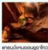
แกรนด์แคนยอนยูลาโกว