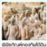
เมืองโบราณที่หลงใหลได้ฉ่ำ