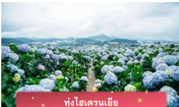
ทุ่งไฮเดรนเยีย

นำท่านเล่น นั่งโรลเลอร์โคสเตอร์ ชมธรรมชาติท่ามกลางป่าสนไปยัง น้ำตกตาดันลา สัมผัสอากาศบริสุทธิ์และบรรยากาศสดชื่น พร้อมจิบเครื่องดื่มชม วิวธรรมชาติ นำท่านเดินทางสู่ ทุ่งไฮเดรนเยีย อีกหนึ่งทุ่งดอกไม้ ที่ไม่ควรพลาดมาถ่ายรูปกัน ข้อดีของที่นี่ คือ ดอกไม้จะบานตลอดทั้งปี