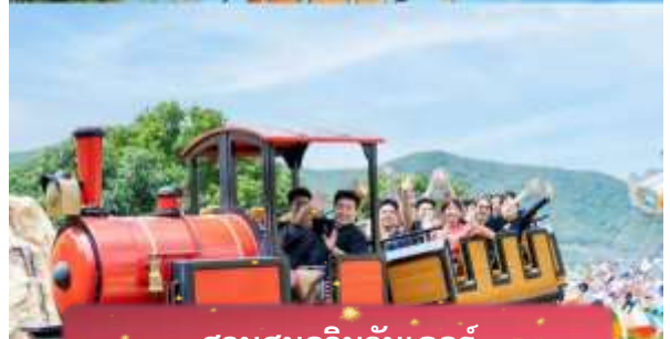
สวนสนุกวินวันเดอร์