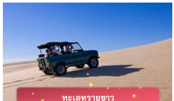
ทะเลทรายขาว

เช้า บริการอาหารเช้า ณ ห้องอาหารของโรงแรม นำท่านเดินทางสู่ ทะเลทรายขาว กองทรายสีขาวกว้างใหญ่ เพลิดเพลินกับการนั่งรถจี๊ปตะลุยทะเลทราย พร้อมกิจกรรมสนุกสนาน เช่น ขับ ATV และเล่นแซนด์ดูลิ้นไกล (รวมเฉพาะค่ารถจี๊ป ไม่รวมค่าทิปแล้วแต่ความพึงพอใจ) นำท่านเดินทางสู่ เมืองดาลัด เมืองท่องเที่ยวทางตอนใต้ของเวียดนาม ตั้งอยู่บนที่ราบสูงลัมดง มีอากาศเย็นตลอดปีจนได้รับสมญานาม “เมืองแห่งดอกไม้” และ “สวิตเซอร์แลนด์แห่งตะวันออก” โดดเด่นด้วยธรรมชาติภูเขา ทะเลสาบ น้ำตก และไร่กาแฟ รวมถึงสถาปัตยกรรมฝรั่งเศสที่ยังคงหลงเหลือ ทำให้ดาลัดเป็นจุดหมายยอดนิยมสำหรับการพักผ่อนและโรแมนติก