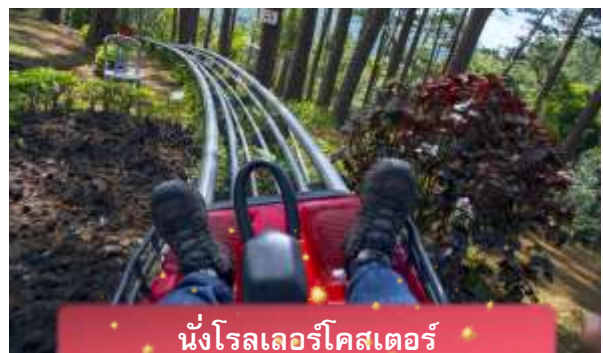
นั่งโรลเลอร์โคสเตอร์