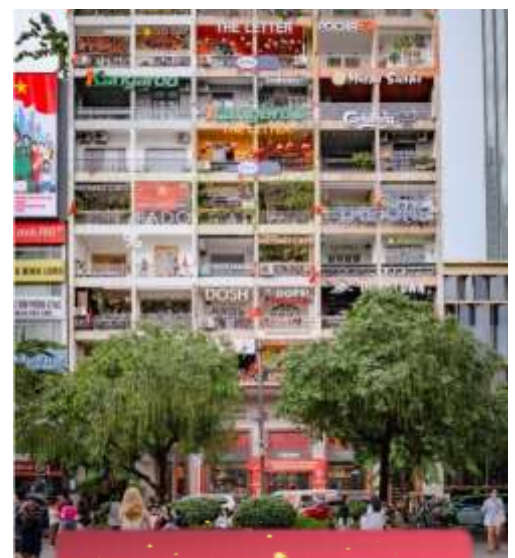
The Cafe Apartment.

ที่พัก Sai Gon Emerald ระดับ 4 ดาวห้องถิ่นหรือเทียบเท่า