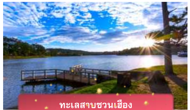
ทะเลสาบชวนเอียง

ที่พัก The Western Hill ระดับ 4 ดาวหรือเทียบเท่า