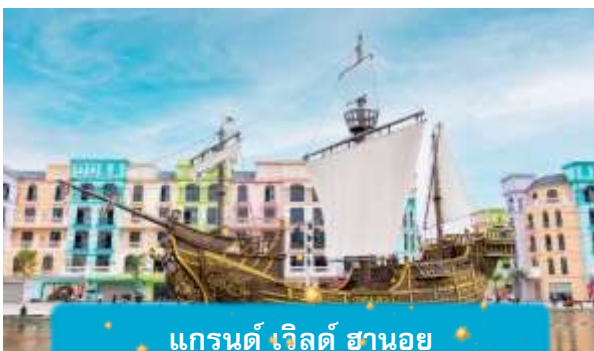
แกรนด์ เวิลด์ ฮานอย