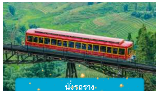
นั่งรถราง

เที่ยง บริการอาหารกลางวัน ณ ภัตตาคาร พิเศษ ... เมนูบุฟเฟ่ฟานซีปัน