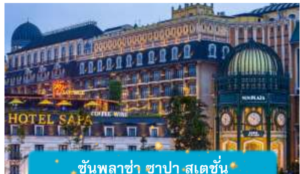
ชั้นพลาซ่า ซาปา สเตชั่น