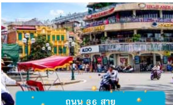
ถนน 36 สาย

21.05 เดินทางถึง สนามบินสุวรรณภูมิ ประเทศไทย โดยสวัสดิภาพ ... พร้อมความประทับใจ