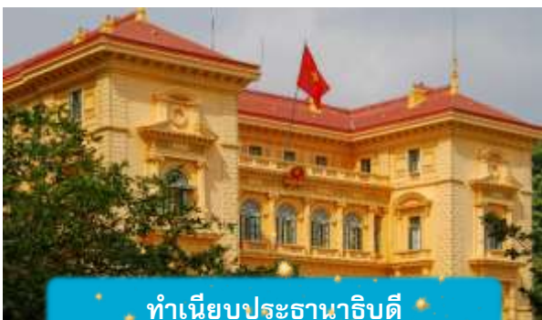
ทำเนียบประธานาธิบดี

เช้า บริการอาหารเช้า ณ ห้องอาหารของโรงแรม นำท่านถ่ายรูปด้านนอก สุสานโฮจิมินห์ จุดเริ่มต้นของการเข้าใจเวียดนาม สถานที่อันเงียบสงบที่สะท้อนจิตวิญญาณของผู้นำผู้ยิ่งใหญ่ สุสานแห่งนี้ไม่ได้เป็นเพียงอนุสรณ์ แต่คือบทเรียนประวัติศาสตร์ที่สัมผัสได้จริง นำท่านเดินทางสู่จุดศูนย์กลางแห่งประวัติศาสตร์เวียดนาม นำชมด้านนอก ทำเนียบประธานาธิบดี อาคารสีเหลืองอร่ามในสไตล์ฝรั่งเศส ที่ยังคงใช้ในพิธีการสำคัญของชาติและชม บ้านพักลุงโฮ บ้านไม้เรียบง่ายริมสระบัว ที่เผยให้เห็นชีวิตสมถะของผู้นำผู้ยิ่งใหญ่ "โฮจิมินห์" สองสถานที่ สองเรื่องราวที่สะท้อนความเป็นเวียดนามอย่างลึกซึ้ง ไม่ใช่แค่ท่องเที่ยว แต่คือการเข้าใจจิตวิญญาณของประเทศนี้อย่างแท้จริง เที่ยง บริการอาหารกลางวัน ณ ภัตตาคาร