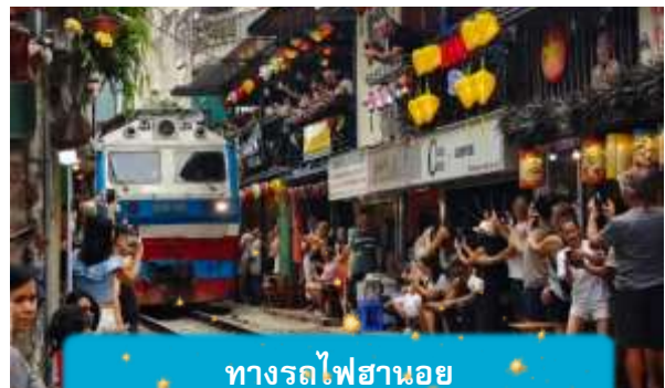
ทางรถไฟฮานอย