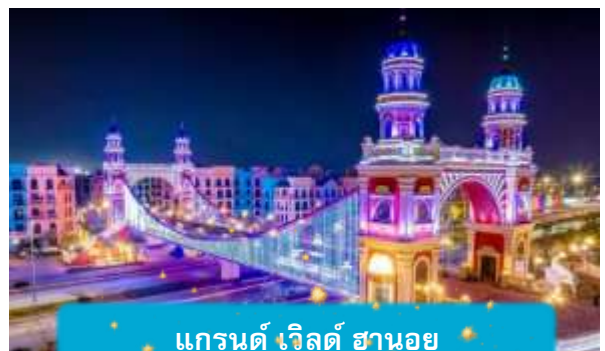
แกรนด์ เวิลด์ ฮานอย