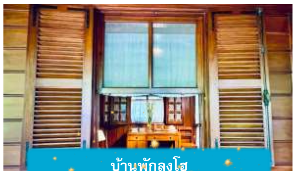
บ้านพักลุงโฮ