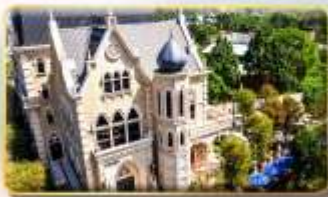
ปราสาทช็อคโกแลตนี้น่า

เมืองซงชี่ หรือเทียบเท่า 3-4* สามารถดูรูปได้ครับ เมืองโกจง หรือเทียบเท่า 3-4* สามารถดูรูปได้ครับ เมืองไทเป หรือเทียบเท่า 3-4* สามารถดูรูปได้ครับ