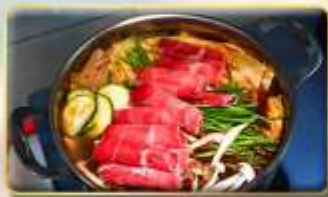
พิเศษ.. Buffet New Mala Hotpot Free Flow Beer & Soft Drink