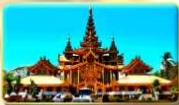
พระราชวังบุเรงนอง