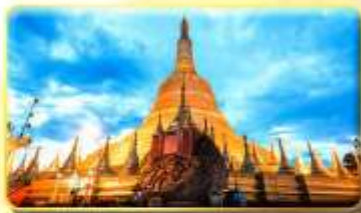
เจดีย์ชเวอดอร์