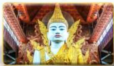
วัดหงากัดจี