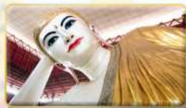
พระนอนคาทาวน