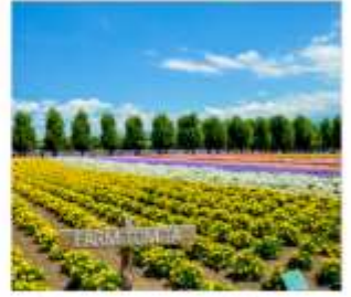
ทุ่งลาเวนเดอร์โทมิตะ