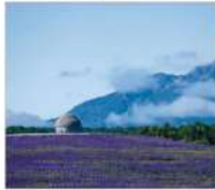
เนินพระพุทธรเจ้า