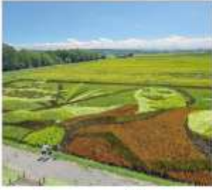
ติลปะบนทุ่งนา