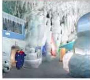
พิพิธภัณฑน์น้ำแข็ง