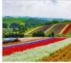
ทุ่งดอกไม้หลากสี