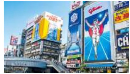
หรือเลือกทัวร์เสริม

อาทิ ย่านชินไซบาชิ คือถนนคนเดินเส้นยาว อีกทั้งยังเป็นย่านการค้าชื่อดังของเมืองโอซาก้า ที่เต็มไปด้วยร้านค้าเก่าแก่ปะปนไปกับร้านค้าทันสมัย และมีสินค้าหลากหลายรูปแบบ ไม่ว่าจะเป็นเสื้อผ้า รองเท้า เครื่องสำอาง ฯลฯ นอกจากนี้ยังเป็นแหล่งบันเทิงชั้นนำแห่งหนึ่งของเมือง รวมทั้งมีร้านอาหารทะเลขึ้นชื่อมากมาย ส่วนตรงกลางของถนนจะมีสะพานข้ามคลองซึ่งถือเป็นจุดถ่ายรูปยอดนิยม นั่นก็คือตึกที่มีสัญลักษณ์คนวิ่งชูมืออันเป็นเครื่องหมายการค้าของกูลิโกะ