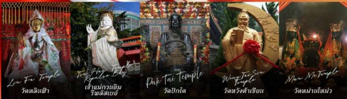
Linn Fe Temple วัดหลินฟ้า

รายการทัวร์ข้างต้นอาจมีการปรับเปลี่ยนเพื่อความเหมาะสม