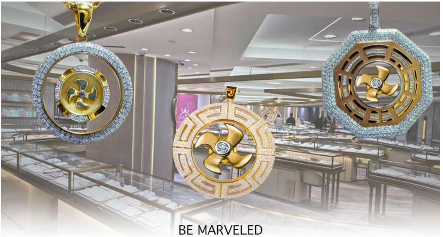
BE MARVELED ศูนย์อวรุญ กัณฑ์เศรษฐี

และนำท่านชม ศูนย์ปี่เซี่ยะ ซึ่งคนจีนนั้น ถือว่าหยกเป็นหิน ที่เป็นตัวแทนของความสวยงามและความบริสุทธิ์มีความเชื่อว่าหยก มงคล ถ้าพกติดตัวไว้จะอายุยืนและสุขภาพดีมีสินค้ำมากมายเกี่ยวกับหยก อาทิ กำไลหยก หรือสัตว์นำโชคอย่างปี่เซี่ยะ ให้ท่านได้เลือกซื้อเป็นของฝาก, ของที่ระลึก หรือของนำโชคแต่ตัวท่านเอง