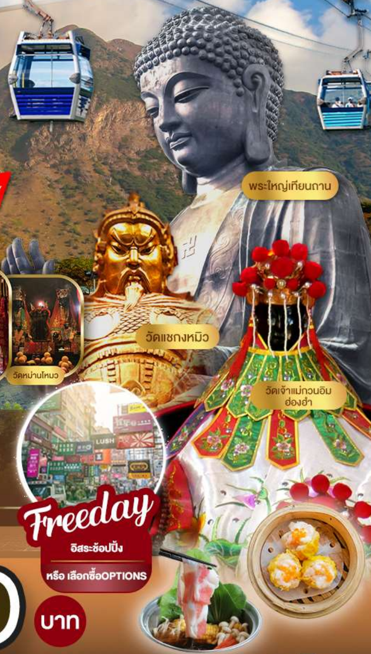
พระใหญ่เทียนถาน