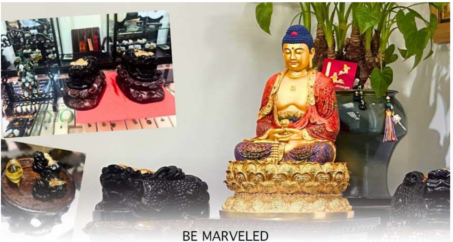
BE MARVELED ศูนย์ปี่เซี่ยะ

และนำท่านชม ศูนย์ปี่เซี่ยะ ซึ่งคนจีนนั้น ถือว่าหยกเป็นหิน ที่เป็นตัวแทนของความสวยงามและความบริสุทธิ์มีความเชื่อว่าหยก มงคล ถ้าพกติดตัวไว้จะอายุยืนและสุขภาพดีมีสินค้ำมากมายเกี่ยวกับหยก อาทิ กำไลหยก หรือสัตว์นำโชคอย่างปี่เซี่ยะ ให้ท่านได้เลือกซื้อเป็นของฝาก, ของที่ระลึก หรือของนำโชคแต่ตัวท่านเอง