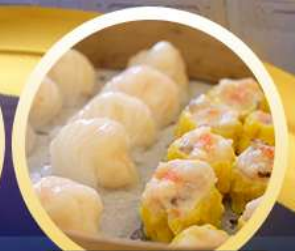
ติ่มซำฮ่องกง