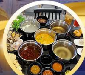
ชาบูฮ่องกง