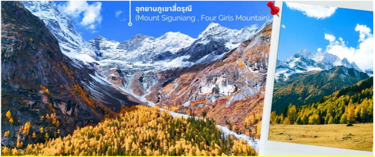
อุทยานภูเขาสี่ดรุณี (Mount Siguniang , Four Girls Mountain)

มัทรีมา ผสมผสานกับป่าไม้เขียวขจีราวกับดินแดนสวรรค์ ส่วนบริเวณใกล้เคียงยังเป็นที่ตั้งของหมู่บ้านชาวทิเบตที่มีวิถีชีวิตเรียบง่าย อีกจุดที่ควรค่าแก่การเข้าไปเยี่ยมชม สัมผัสวิถีแบบดั้งเดิมอย่างใกล้ชิด