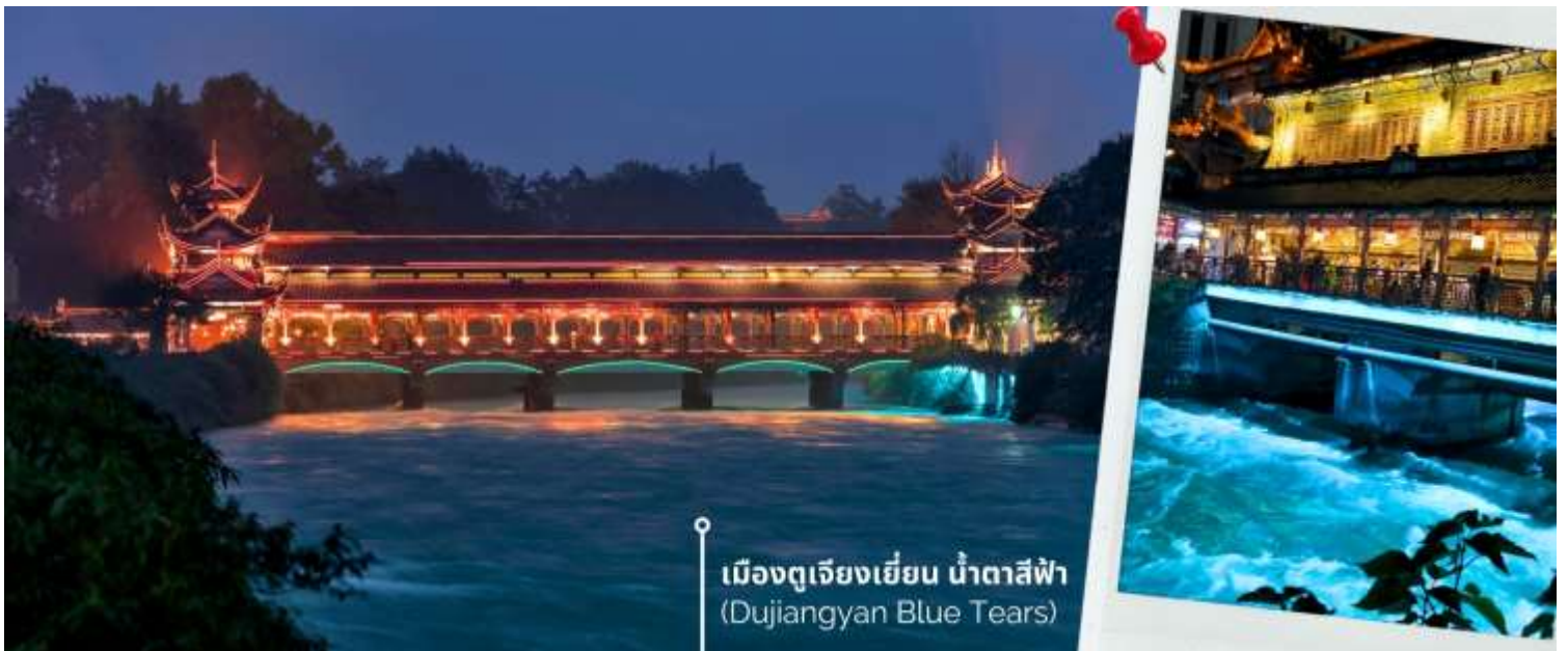
เมืองตูเจียงเยียน น้ำตาสีฟ้า (Dujiangyan Blue Tears)

นำท่านเดินทางสู่ เมืองโบราณตูเจียงเยียน เมืองนี้เป็นแหล่งโครงการชลประทานต้นแบบสมัยโบราณที่มีประวัติยาวนานมากกว่า 2,274 ปี ตั้งอยู่ในมณฑลเสฉวน เพื่อแก้ปัญหาน้ำท่วมในพื้นที่ลุ่มแม่น้ำ Minjiang และเพื่อจัดสรรน้ำสำหรับการเกษตรนี้ โดยการสร้างควบคุมน้ำที่ไม่ต้องพึ่งพาเขื่อนชลประทานนี้ยังคงใช้งานได้ดีจนถึงปัจจุบันและได้รับการยกย่องให้เป็นหนึ่งในมรดกโลกโดยองค์การยูเนสโก และยังเป็นต้นแบบของภูมิปัญญาด้านการจัดการทรัพยากรน้ำของจีน ไม่เพียงแต่ได้รับการ ยกย่องในด้านวิศวกรรมอันชาญฉลาดและประโยชน์ต่อระบบนิเวศเท่านั้นแต่ยังเป็นที่ยู่อักในฐานะสถานที่ชมความงามของปรากฏการณ์ “น้ำตาสีฟ้า” ที่ตราตรึงใจนักท่องเที่ยวทั่วโลก ให้ท่านเข้าชม ธารน้ำสีฟ้า Blue Tears เป็นจุดท่องเที่ยวที่เต็มไปด้วยมนต์เสน่ห์แห่งสถาปัตยกรรมจีนแบบดั้งเดิม ทอดยาวข้ามแม่น้ำ กลายเป็นภาพอันน่าประทับใจยามค่ำคืนเมื่อแสงไฟตกแต่งส่องสะท้อนน้ำให้กลายเป็นสีฟ้าเงิน ดูสวยงามราวกับโลกแห่งจินตนาการ ความพิเศษอยู่ที่การจัดไฟอย่างประณีต ซึ่งช่วยเน้นให้สะพานมีชีวิตชีวาท่ามกลางบรรยากาศยามค่ำคืนที่รายรอบไปด้วยภูเขาและต้นไม้เพิ่มความรู้สึกสงบและสดชื่น เมื่อเดินข้ามสะพานนี้แล้วได้สัมผัสกับบรรยากาศรอบๆ มีแสงไฟที่ส่องประกายลงสู่ผืนน้ำจึงเป็นประสบการณ์ที่ทำให้รู้สึกผ่อนคลายและเต็มไปด้วยความประทับใจที่ยากจะลืม