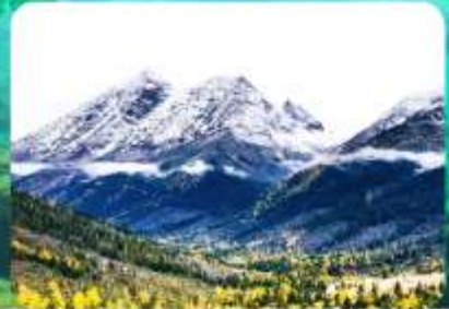
อุทยานสี่ดรุณี