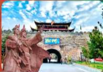
เมืองโบราณของพาน