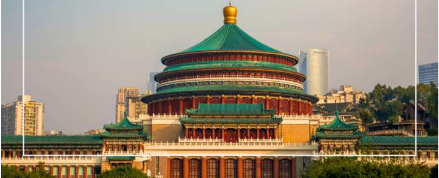
มหาศาลาประชาชนแห่งเมืองฉงชิ่ง (Chongqing People's Grand Hall)

เที่ยง บริการอาหารเที่ยง ณ ภัตตาคาร (มื้อที่ 7) เมนูพิเศษ : สุกี้หม่าล่า