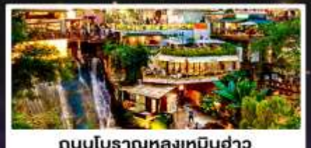
ถนนโบราณหลงเหมินฮ่าว