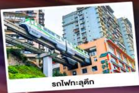
รถไฟฟ้าทะลุตึก