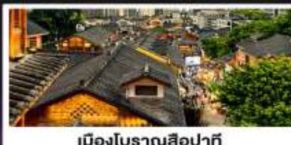
เมืองโบราณสี่ปาที้