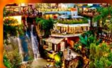
ถนนโบราณหลงเหมินฮ่าว