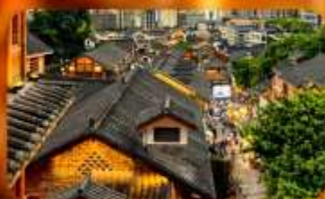
เมืองโบราณสี่ปาตี