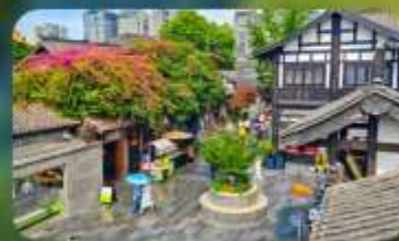
ถนนชอยกวางชอยแคบ