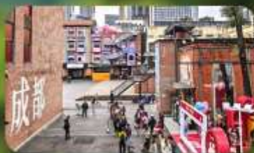
ดงเจียวจ้ออ๋