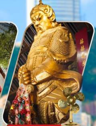
CHE KUNG (SHA TIN)