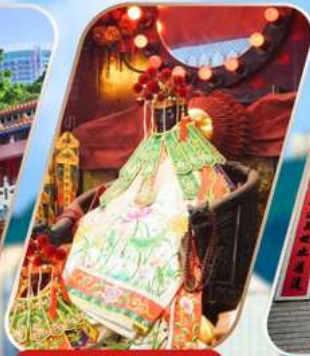
KWAN YUM HH