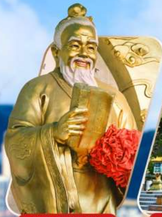
WONG TAI SIN